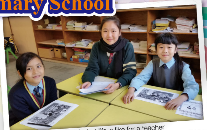
A taste of what life is like for a teacher

We take pride in nurturing students to be responsible and caring young people. Providing help to others is a way to achieve this. In March, 2017, 11 students from our school had TSA Oral Practice with 30 primary school students from Yaumati Catholic Primary School. Our students found that it was a fruitful experience as they could have a taste of what life is like for a teacher.