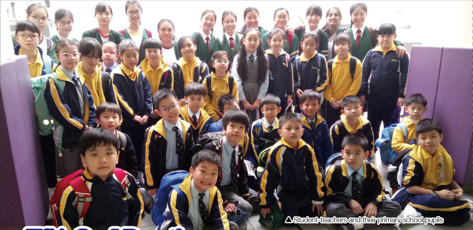
△ Student-teachers and their primary school pupils