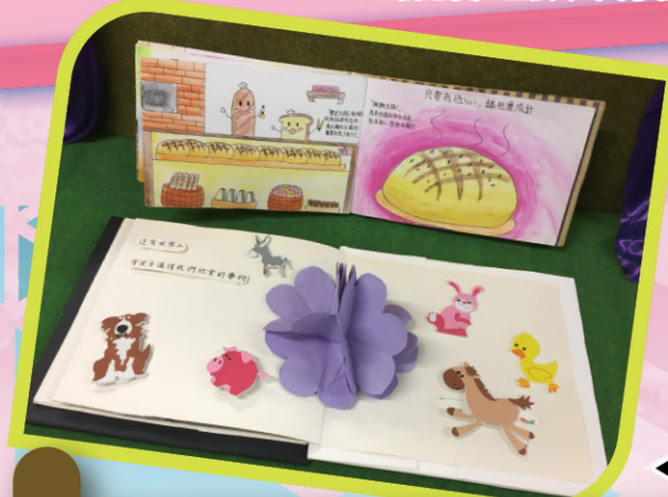
◀ 每一頁都花上心思