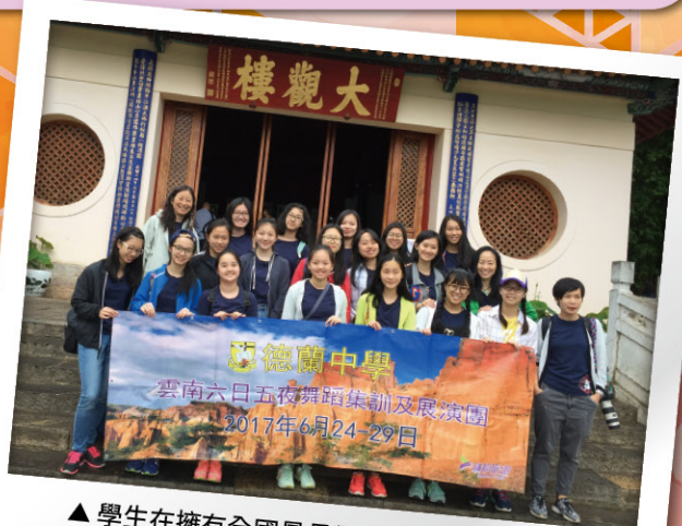
▲ 學生在擁有全國最長對聯的大觀樓前留影