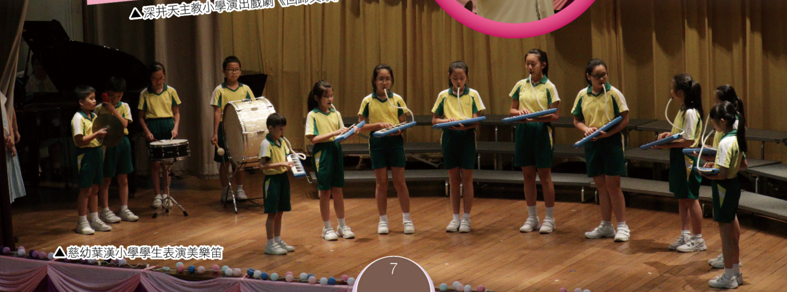
△ 慈幼葉漢小學學生表演美樂笛