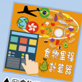
▲ (B) 食物里程計算器