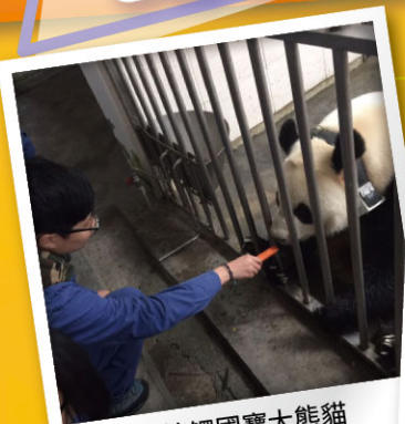
▲ 親身接觸國寶大熊貓

可是，有人會反駁：「大熊貓會襲擊人類飼養的家禽，損害人類利益的，根本無法幫助人類。」這種說法實在有點自私，人類隨着時代發展之時，往往侵佔了大熊貓的居住地，也蠶食了牠們的食糧及棲息地，令牠們無法生活，牠們才會襲擊人類的。所以，人類在享用大自然的資源之時，也應同樣有義務去保障其他生物享用天然資源的權利。