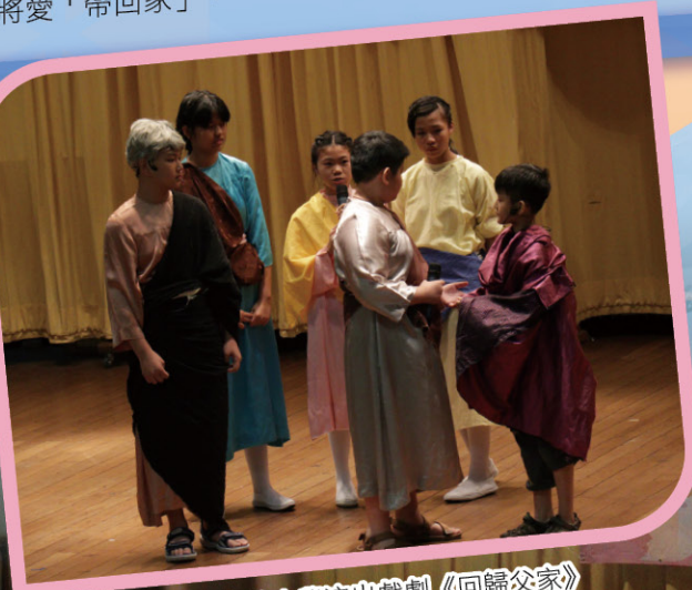
△ 深井天主教小學演出戲劇《回歸父家》