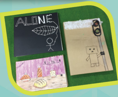
▲ 線條簡約而具創意

本年度視藝科先與家教會合作舉辦孝親心意展續紛展覽，透過多元創作，如拼貼、移印、捲紙等，讓學生發揮創意，展示孝道的傳統美德。其後再將這份尊重家庭的精神擴展至身邊的各兄弟姐妹，並透過「繪本」的創作，深化學生的家庭觀念。學生設計繪本時結合科學中關於電的知識理論，且樂意嘗試向高難度的技巧挑戰，其間克服了科學上電流的原理的難關，並結合不同的藝術技巧創作，表現積極用心。藉此活動能鞏固學生對家庭價值的理解及反思外，亦有效地進行跨學科的學習，實踐天主教教育的核心價值，從而建立正確的價值觀。