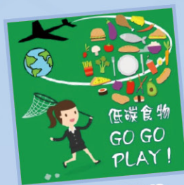
▲ (A) 食物里程遊戲