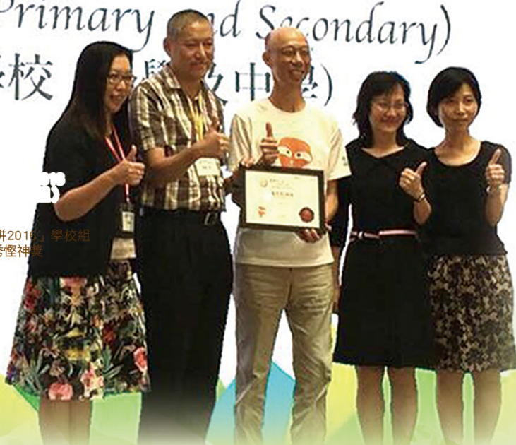
► 本校榮獲「慳神大比拼2016」學校組 (小學及中學組) 優秀慳神獎

School (Primary and Secondary) 學校 (小學及中學)