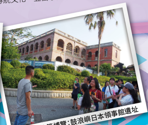
▲萬國建築博覽：鼓浪嶼日本領事館遺址