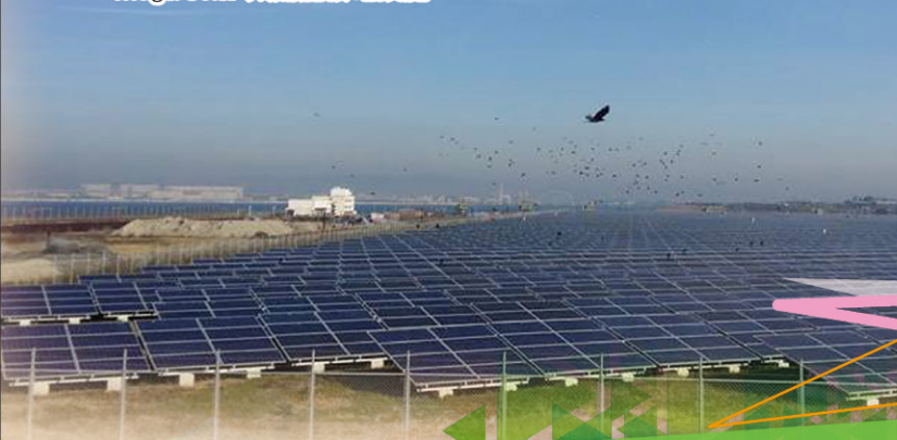
▼ Mega solar 太陽能發電設施