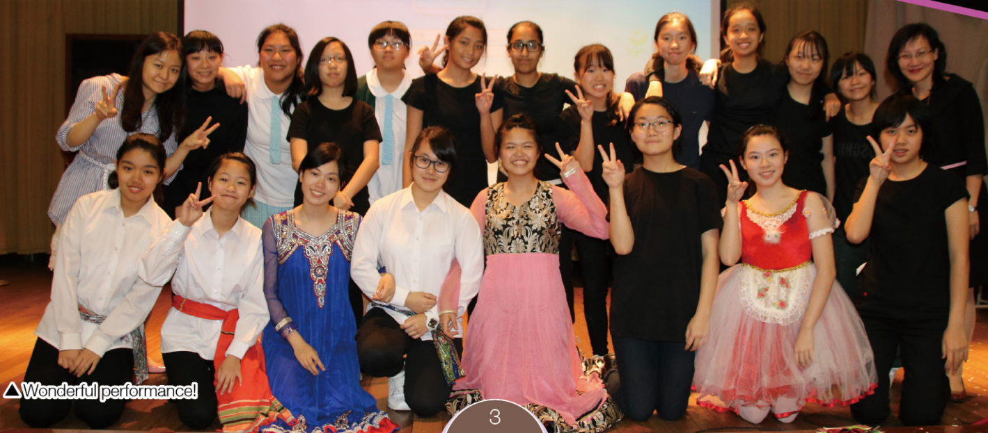
△ Wonderful performance!