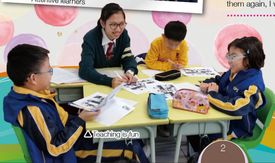
△ Teaching is fun

During the teaching process, I felt very nervous as I was not good at working with children, and I was not really fond of kids. But after this experience, I have totally changed my mindset towards children. The children I worked with were very cheerful and willing to learn new things. Now, I feel more confident in speaking and working with children. I am very thankful that I joined this programme since it was a fun experience.