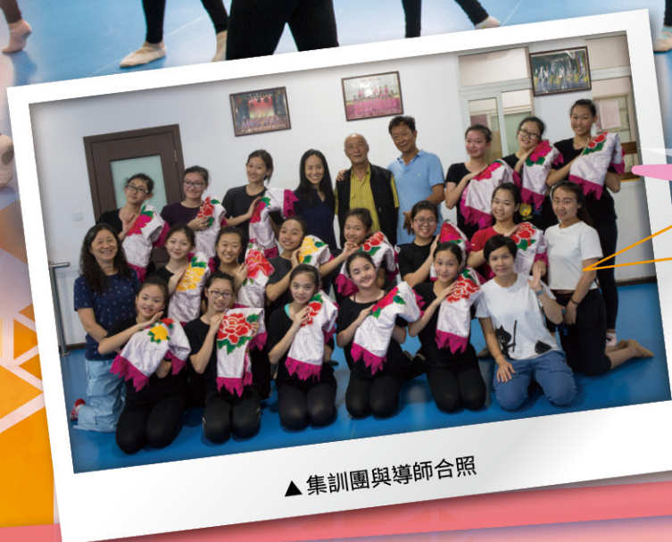
▲ 集訓團與導師合照

最後非常感謝學校為我們安排這個集訓的機會，亦感謝各位老師的照顧和配合，希望以後能有機會參與更多相關活動。