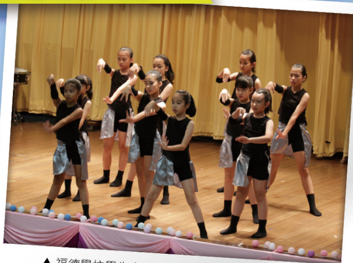
▲ 福德學校學生表演舞蹈作品Harmony of fusion

最後，甘寶維神父於音樂會中亦鼓勵學生要以實際的行動來愛護家人，並教授學生以非洲文唱出讚美耶穌的歌曲，藉歌聲將愛「帶回家」。