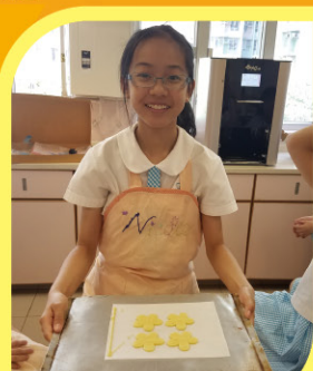
▲看！我第一份3D打印的花花曲奇！