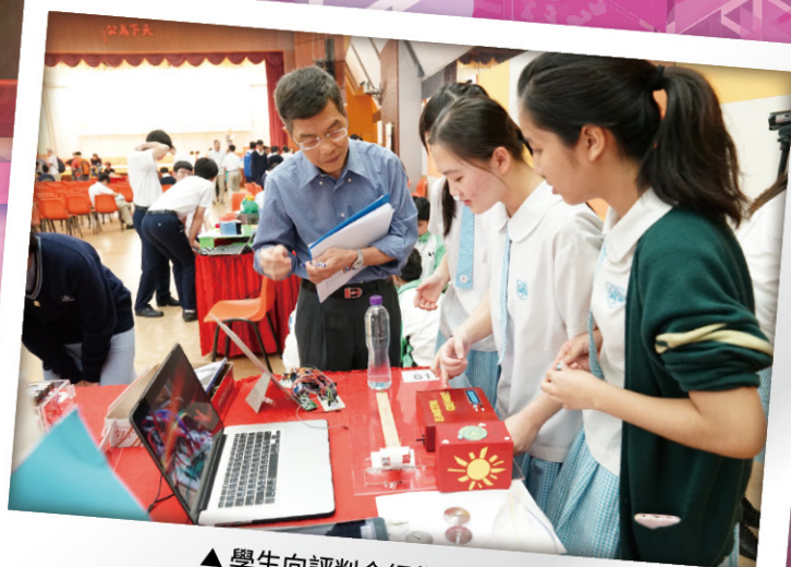
▲學生向評判介紹作品

透過參加這次比賽，我清晰地明白地震探測的基本原理。在製作過程中，我們經歷了無數次失敗，但從沒放棄，從失敗中吸取教訓，最終我們完成了作品。