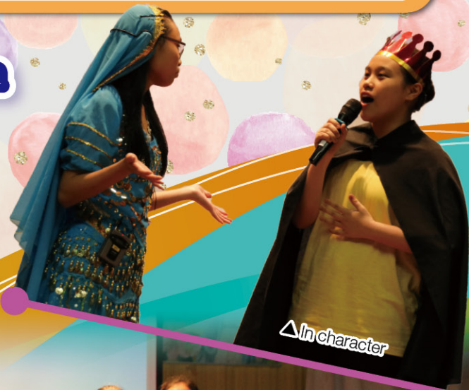
△ In character

The Inter-class Drama Competition is an annual event that showcases students' talents in acting and design. The aim of the competition is to help students learn English in a fun way and to improve their English speaking and communication skills. Each class is given a different script and students have to create their own props, costumes and backdrops, as well as be responsible for the sound effects and lighting for their drama performance. Students found that it was an unforgettable learning experience.