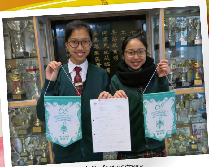
▲ Perfect partners