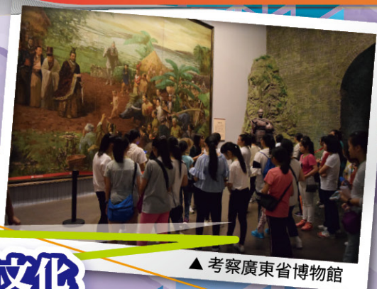
▲考察廣東省博物館