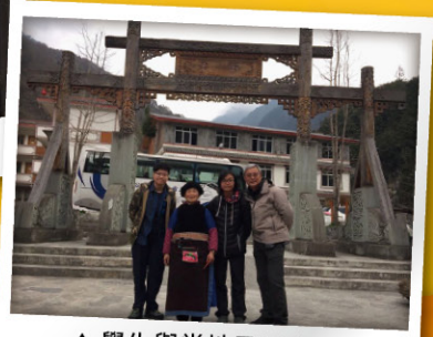
▲ 學生與當地居民合照