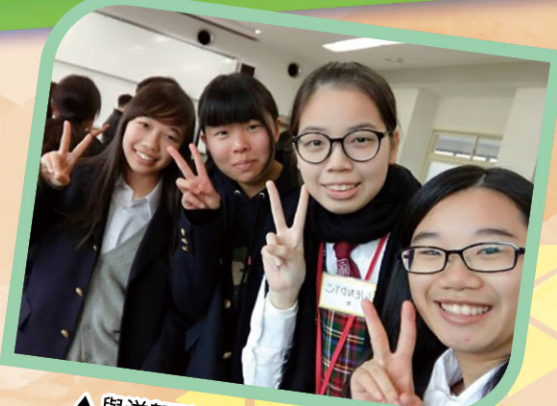
▲ 與滋賀縣學校的同學合照