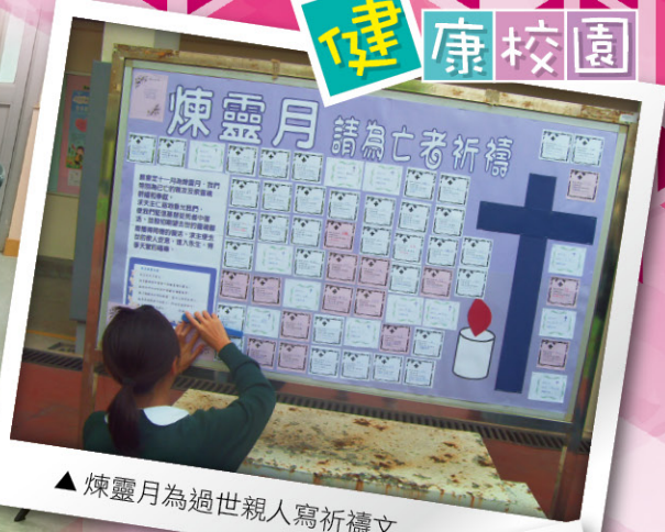
▲ 煉靈月為過世親人寫祈禱文