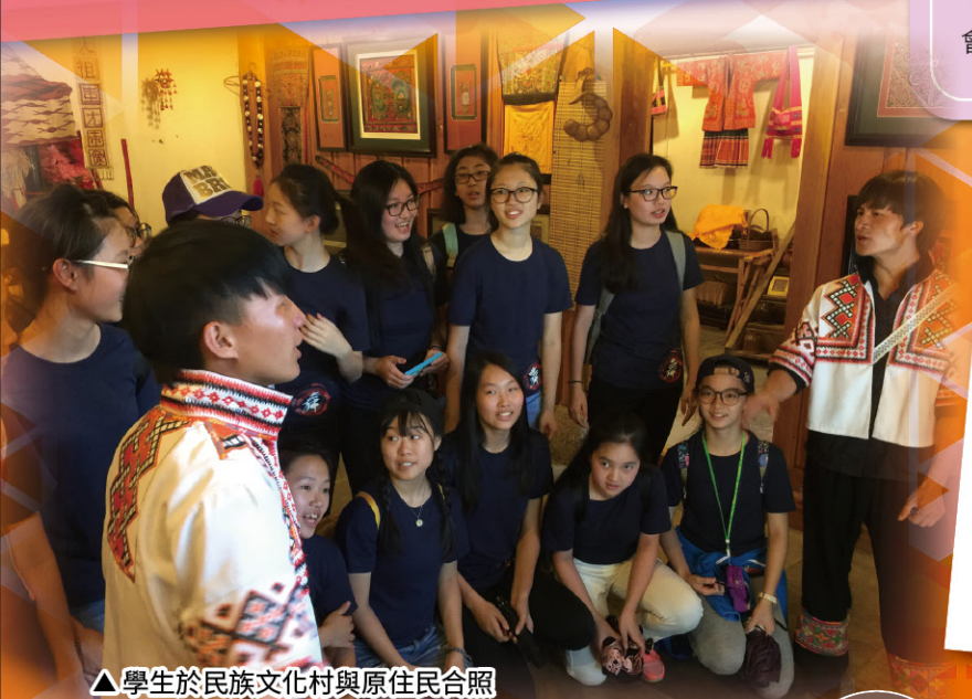
▲ 學生於民族文化村與原住民合照

中國舞蹈隊於24-29/6/2017前往雲南參加集訓及展演。活動承蒙於中國舞蹈家協會主辦的「全國少兒舞蹈比賽」中多次獲獎的李錦榮老師親自教授，雲南省歌舞劇院國家一級舞蹈編導周培武老師親臨觀賞，令學生獲益良多。學生與民族舞蹈團交流及展演時，對當地學員的紮實根基深表佩服，老師亦盛讚本校學生學習能力高，勤奮練習，於短短的四天已掌握了兩支舞蹈的技巧。