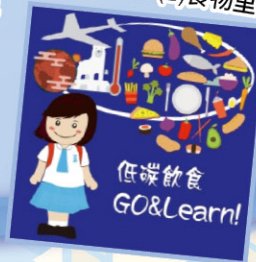
▲ (B) 食物里程計算器