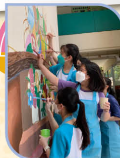
▲ Artists at work