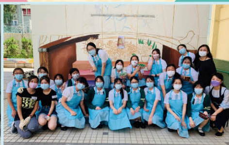
▲ S.4 VA students