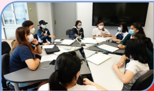
▲ Our students with HKBU students discussing details of the activities