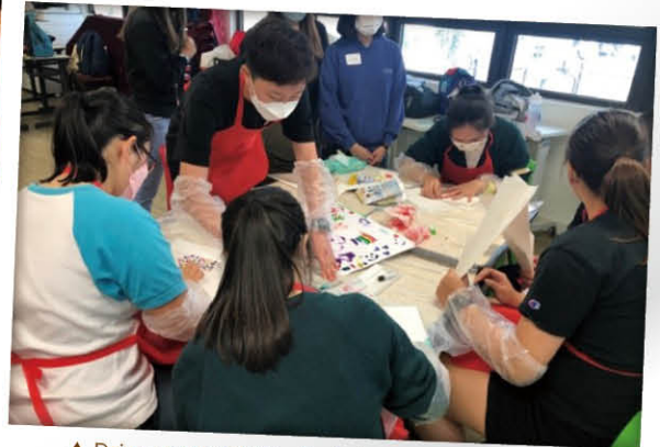
▲ Doing an arts activity with students with special needs

Service Leadership in Learning Communities is a course developed by the General Education Office of Hong Kong Baptist University. The course aims to equip students with the necessary skills to be good service leaders for the community. S.4 and S.5 students took part in six workshops which gave them the opportunity to work with university students to provide service for students with special education needs. Through these learning experiences, our students developed service leadership and critical awareness of the unique characteristics of the socio-cultural context and processes of community building. They were also able to gain a deeper understanding of SEN Youth in the community.