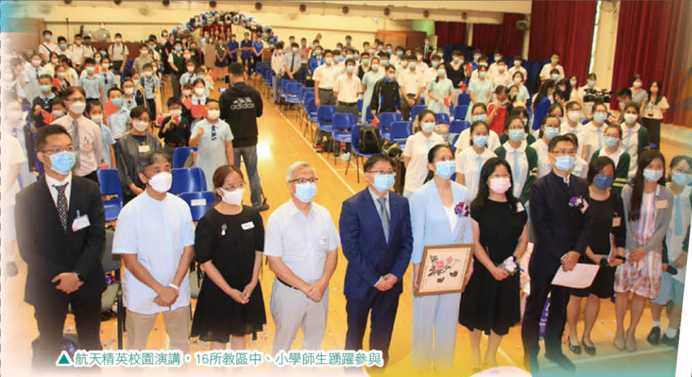
▲ 航天精英校園演講，16所教區中、小學師生踴躍參與