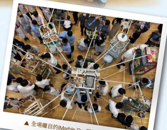
▲ 全場矚目的iMarble Run巨型滾珠機器