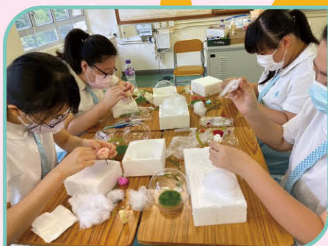
▲ Making globe ornaments requires total concentration.

In the post-exam period, we invited some experts in handicrafts to give master classes to our students. Not only did our girls learn to make exquisite handicrafts from these gurus, but they also learnt about their career path and the ups and downs of working in this sector.