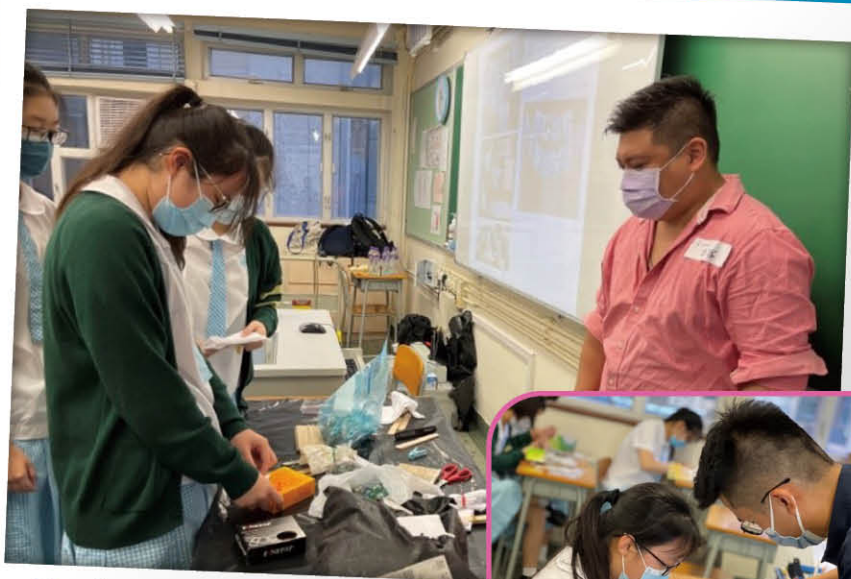
▲ Learning about the different tools used by arborists