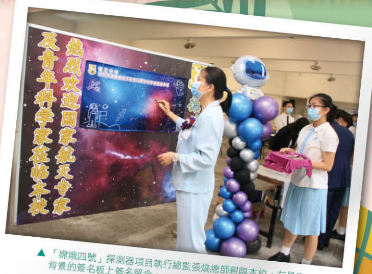
▲「嫦娥四號」探測器項目執行總監張熇總師親臨本校，在星空背景的簽名板上簽名留念。

演講開始前，學生們揮舞國旗迎接張熇總師進場。全體奏唱國歌後，學校更準備了禮炮，在場專家、嘉賓、主教代表助理及校長等齊到台上鳴放禮炮，為是次演講拉開帷幕。