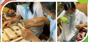
學生認真製作和講解

我在這次iMarble Run的活動中學到使用不同的方法將木板或鐵線等材料製作成需要的形狀。從懵懂不知到熟能生巧，少不了老師的教導和同學的合作，令我們可以完成這部獨一無二的機器。