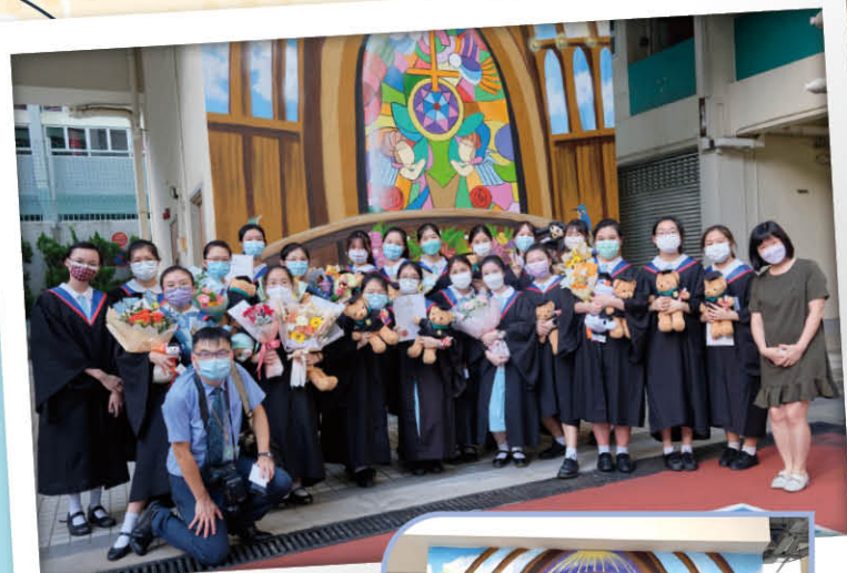
▲ Brand new hotspot on campus

The concept of a 3D painting was to create the visual effect of being inside a chapel. It was designed and created by students. During the school suspension, S.1-5 students attended four online classes to learn the skills of 3D painting. This helped them to achieve their goal of creating a vibrant space for viewers to interact with.