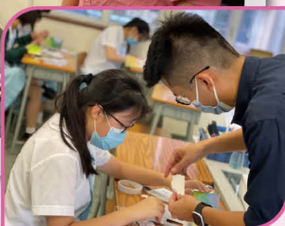
▶ Learning to make VR glasses