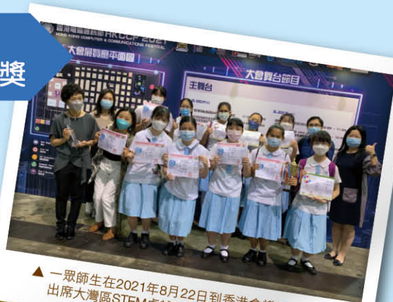
▲ 一眾師生在2021年8月22日到香港會議展覽中心出席大灣區STEM卓越獎頒獎典禮

在比賽的過程中，我對STEM有更深入的了解，學會了如何鋪排應用程式的版面以及編程，我非常開心能有機會參加這次比賽。