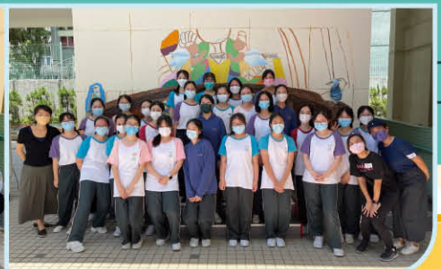
▲ S.3 VA students