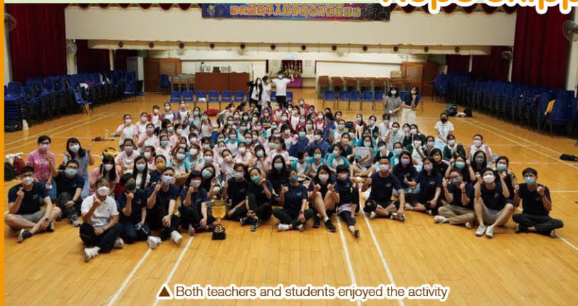
▲ Both teachers and students enjoyed the activity

In response to an appeal by the Catholic Education Office, 99 Diocesan secondary and primary schools as well as kindergartens came together in June 2021 to take part in a rope skipping charity rally in support of the Diocese's church building and development initiatives.