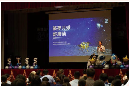
▲ 張熇總師發表演講：航天精神鼓舞學子永不放棄