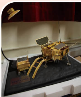
▲ 張熇總師贈送「嫦娥四號探測器模型」給本校

作為航天科技講座的司儀，讓我深感榮幸。因為這個機會難能可貴，在過程中我不僅增廣見聞，更提升了自信及自我表達能力。在撰寫司儀稿時，我們會搜集資料，認識了很多航天科技的知識。而且這個講座，讓我對航天科技有了更多瞭解，因為在平時我很少主動去瞭解航天科技，而這次的機會，我們可以聽到張熇總師的分享，實在很難得。此外，張熇總師也曾說道，航天科技不分性別，也鼓勵了很多女孩子追逐航天科技的夢想。