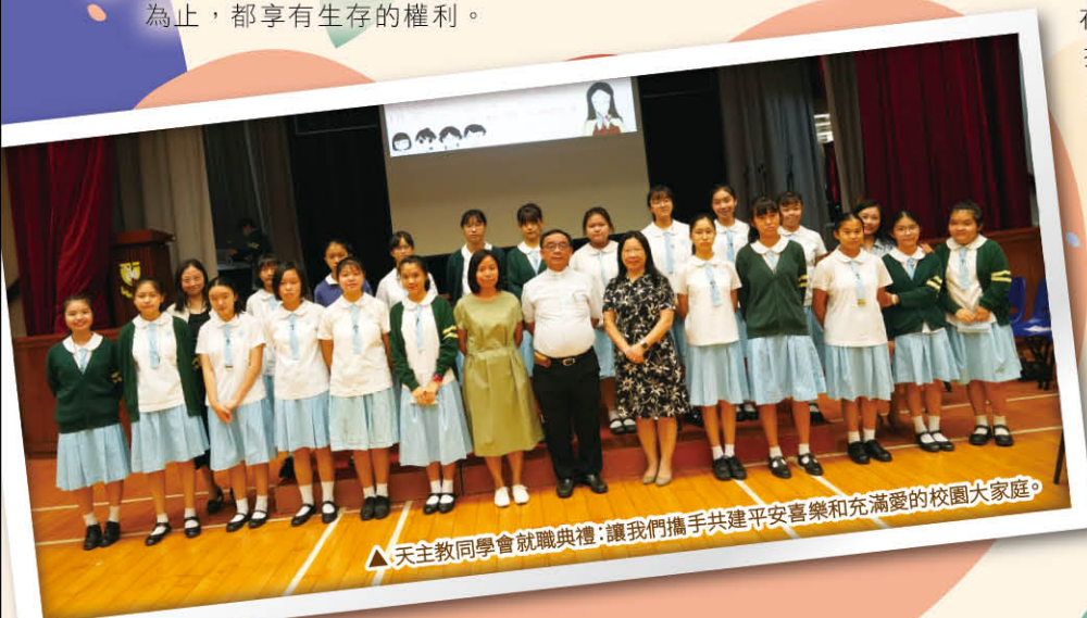
△天主教同學會就職典禮：讓我們攜手共建平安喜樂和充滿愛的校園大家庭。