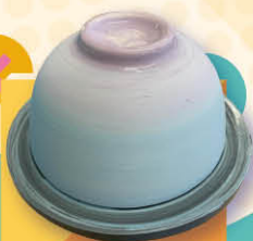
▲ Ceramics class

With only our hands, we can create wonderful products. A group of S.4 and S.5 students participated in the handicraft class where they learnt to make soaps, flower-pressed jewellery and experienced fluid art. Students were especially impressed by what they saw in the fluid art workshop. Students used acrylic paints and fluid art techniques to colour a drawing and a coaster. They learnt to carefully control the flow of the fluid (acrylic paint) and to add patterns using toothpicks. The process of controlling the flow of paint was therapeutic and seeing the combination of colours was delightful. Teachers and students enjoyed the workshop immensely.