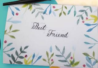
▲ Calligraphy class