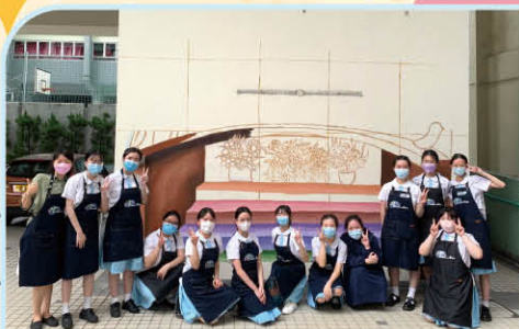
▲ S.5 VA students