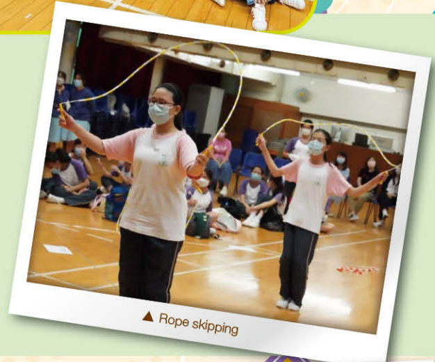
▲ Rope skipping

On 30 th June, student representatives from our school also participated in a skipping day organised by the same schools to manifest communion and the love of the church.