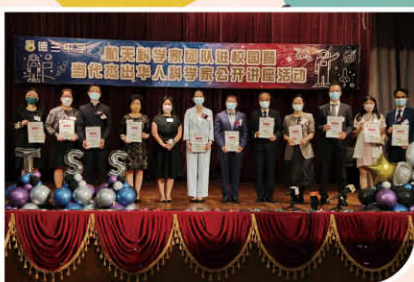
▲ 講座開始前校長頒發紀念狀予各位嘉賓